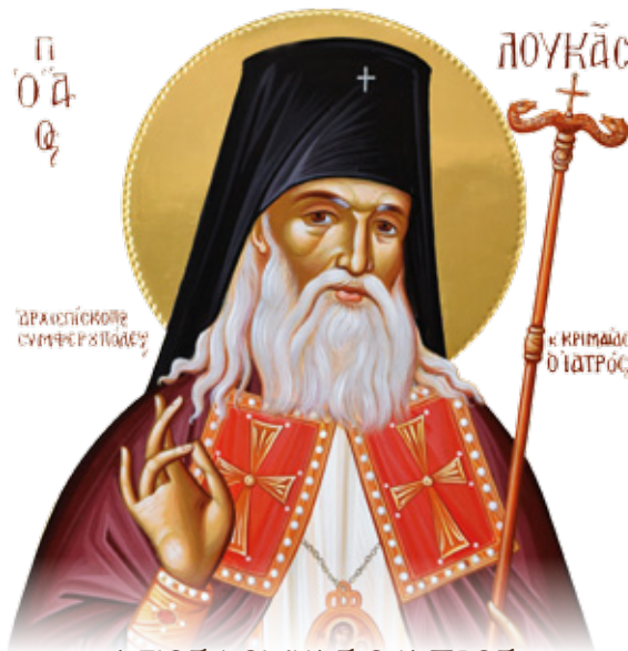
ΑΓΙΟΣ ΛΟΥΚΑΣ Ο ΙΑΤΡΟΣ